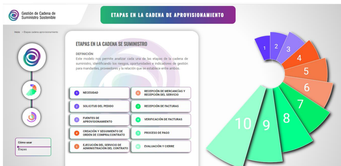
Imagen: Guía de Cadena de Suministro Elaborada por la CCS.

Para ello se establecieron diferentes etapas en la cadena de suministro, que permiten identificar los riesgos, oportunidades e indicadores de gestión.