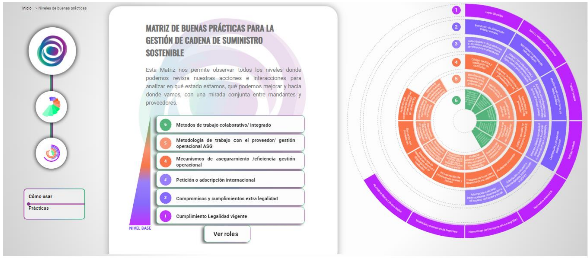
Imagen: Guía de Cadena de Suministro Elaborada por la CCS.